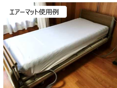
エアーマット使用例